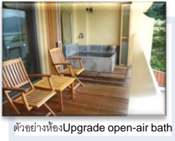
ตัวอย่างห้อง Upgrade open-air bath